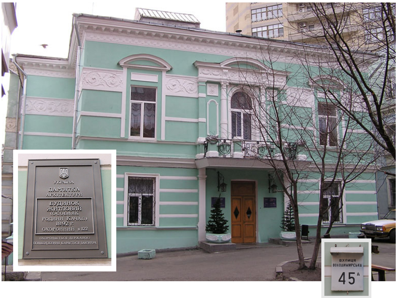
Київський Будинок вчених НАН України

Будинок вчених займає старовинний особняк по вулиці Володимирській, 45-а, у затишному подвір'ї поблизу Золотих воріт. Історія цієї споруди від часу її зведення містить чимало цікавих сюжетів, вартих дослідження та розповіді.