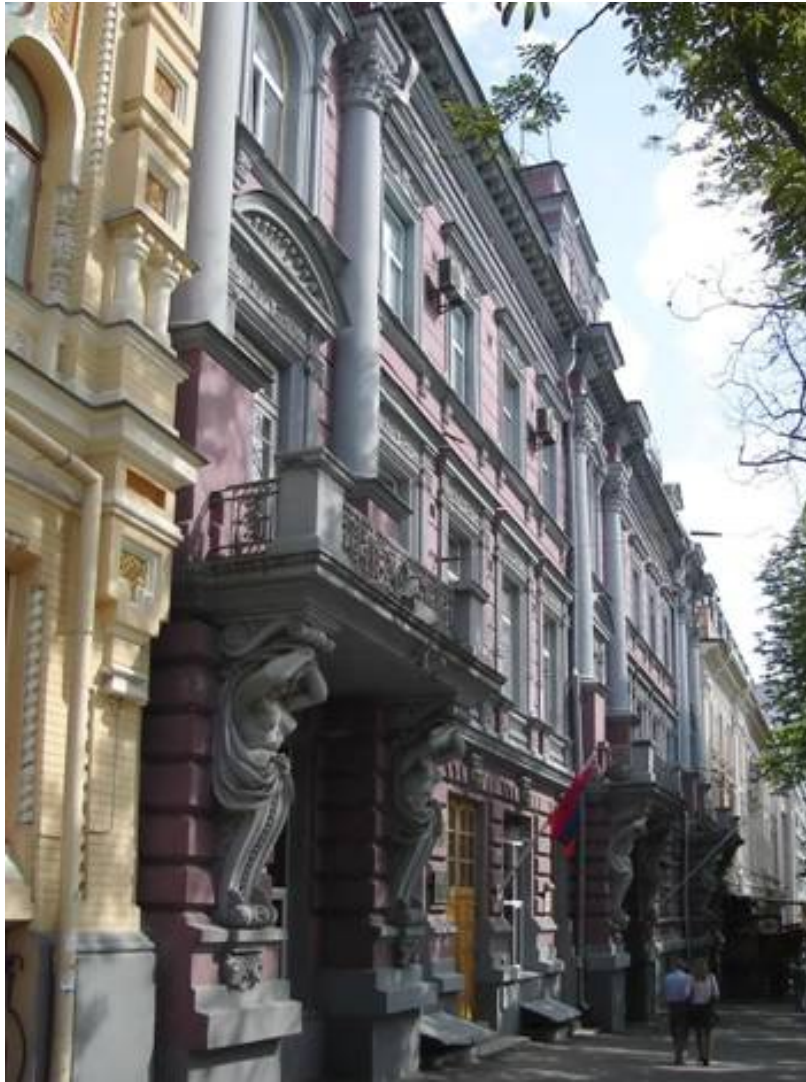
Будинки по вулиці Володимирській. Фото початку 1890-х рр.

Серед останніх технічних захоплень інженера Качали варто назвати електрифікацію.