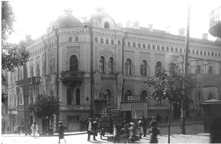
Довоєнне приміщення Будинку вчених на вул. Пушкінській, 1. Фото 1930-х рр.