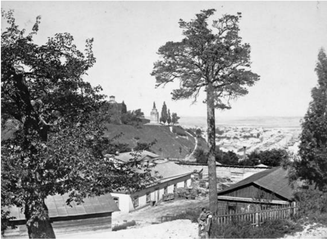
Заклад штучних мінеральних водх Фото 1880-х рр

Втім, у якості фахівця інженер-технолог долучався й до інших справ. Так, у його розпорядженні перебував комплекс «закладу штучних мінеральних вод», що існував від кінця 1860-х років понад Олександрівським узвозом (тепер територія Хрещатого парку понад Володимирським узвозом; будівлі не збереглися).