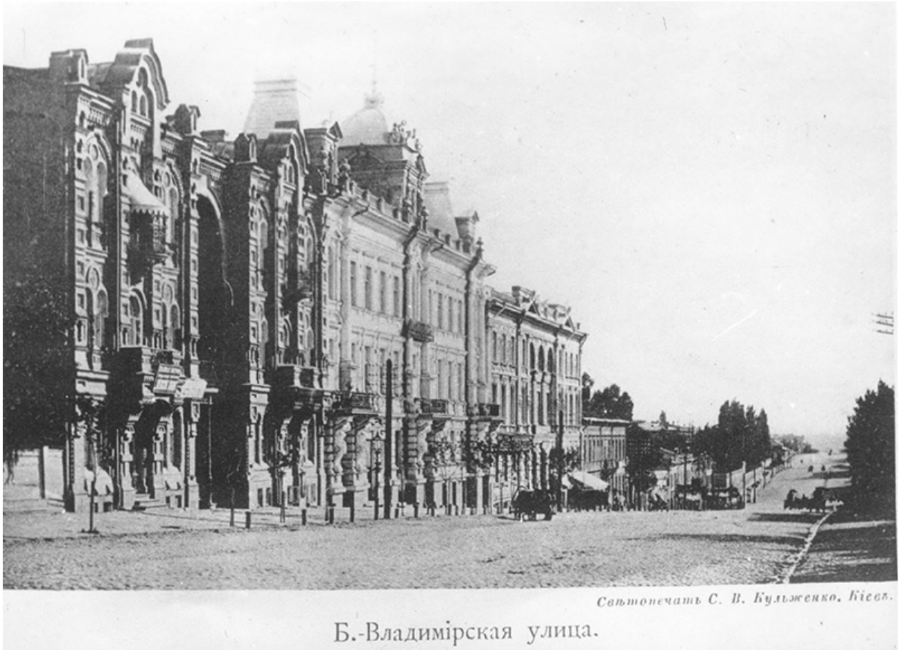
Будинки по вулиці Володимирській. Фото початку 1890-х рр.

Прибутковий будинок був призначений для надання приміщень в оренду. У 1892 році його бічні крила були за проектом того ж Хойнацького подовжені углиб ділянки.