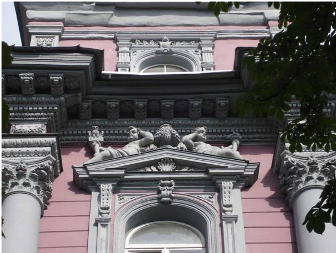
Зображення путті на фасаді будинку по вул. Володимирській, 45