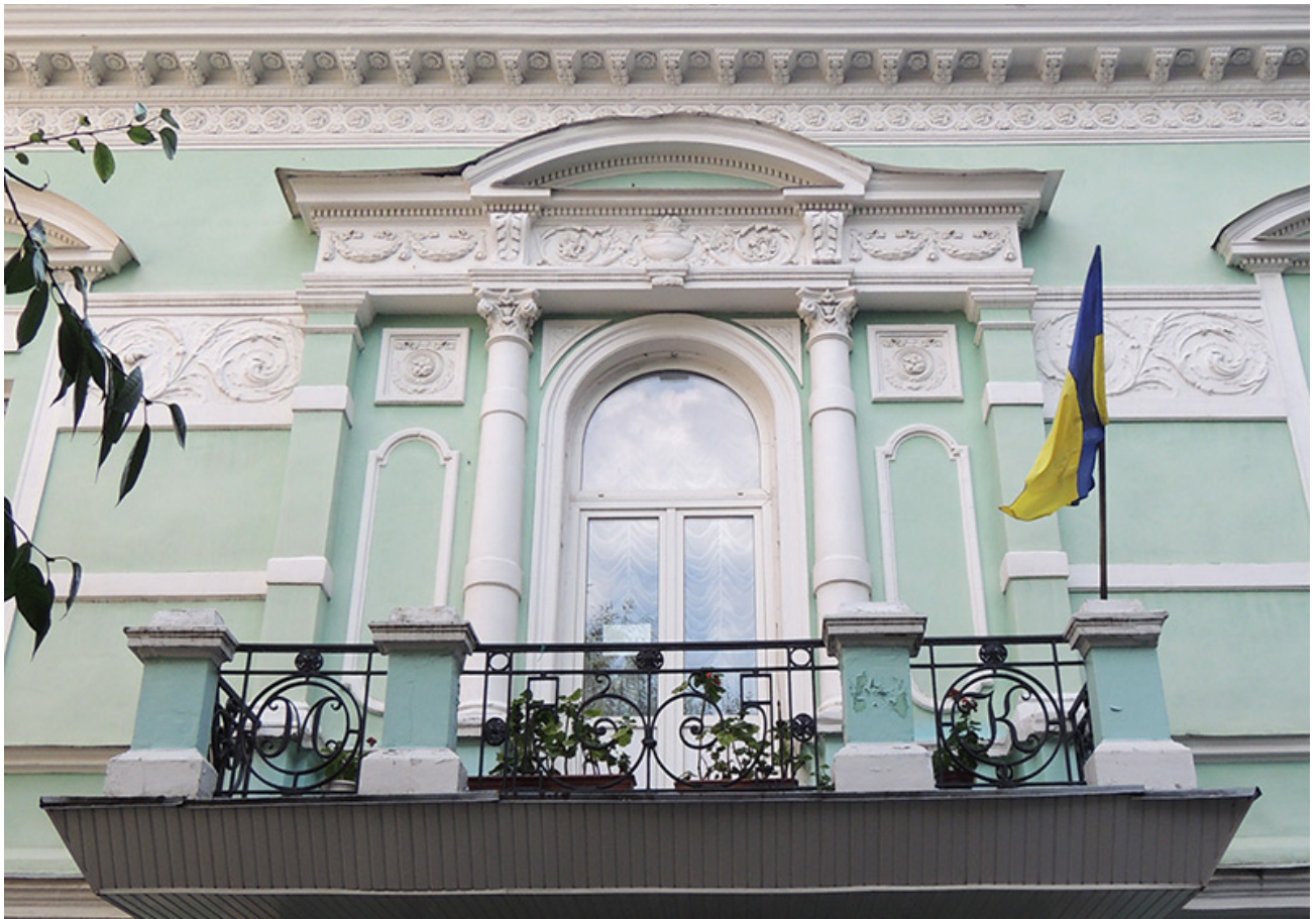
Ініціали «МК» в огорожі балкону Київського Будинку вчених